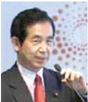
山本 幸三 氏 (衆議院議員) 日本経済再生本部事務局長、財務金融委員会理事、観光立国調査会長、 消費者問題に関する特別委員長、税制調査会幹事 「国策としてのアジア戦略とASPO」